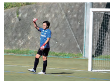
ポジションはゴールキーパーです