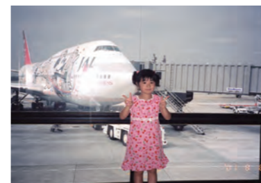
一目惚れしたボーイング747機材