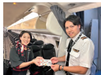
機長としての初フライトは偶然同期とのフライトになりました!