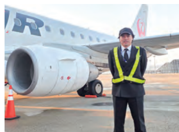
出発前の機体の外部点検を行う際の一枚です

チャーター便に限らず、定期便でも一つとして同じフライトはなく、天候や運航状況により必ずしも同じ場所を飛行するとは限りません。乗るたびにさまざまな表情を見せてくれる空の旅をお楽しみください。