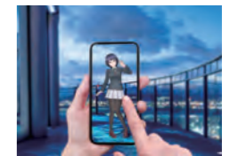
現地でのアプリ体験イメージ (梅田スカイビル)