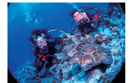
お休みは趣味のマリンアクティビティを楽しみます