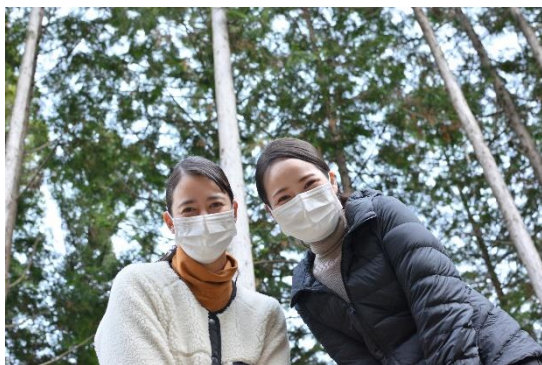
木頭杉と J-AIR 客室乗務員