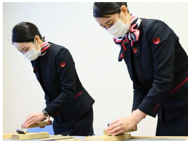
箸作り体験の様子