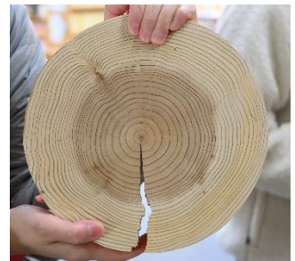
木頭杉断面 （中心の変色箇所が朱杉部分）