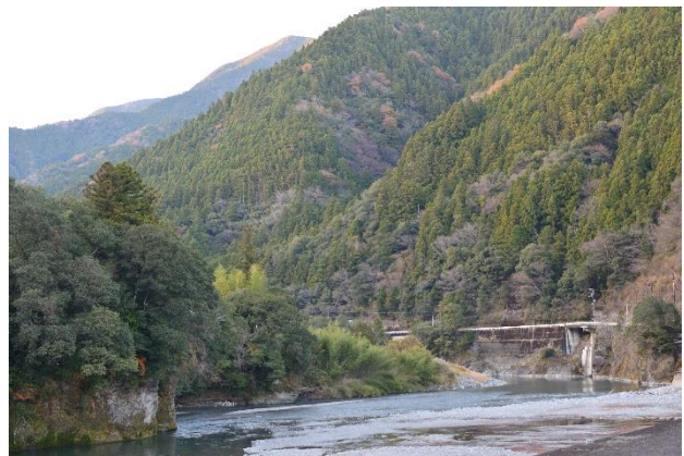
徳島県那賀町木頭地区