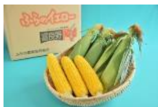
富良野「スイートコーン」