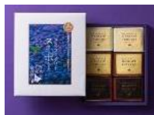
千歳「ハスカップジュエリー」