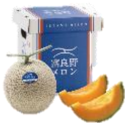
富良野「富良野メロン」